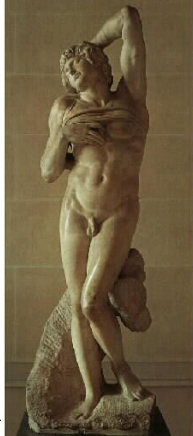
Michelangelo Buonarroti - Umírající otrok (socha)