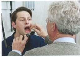
1. Má angínu.