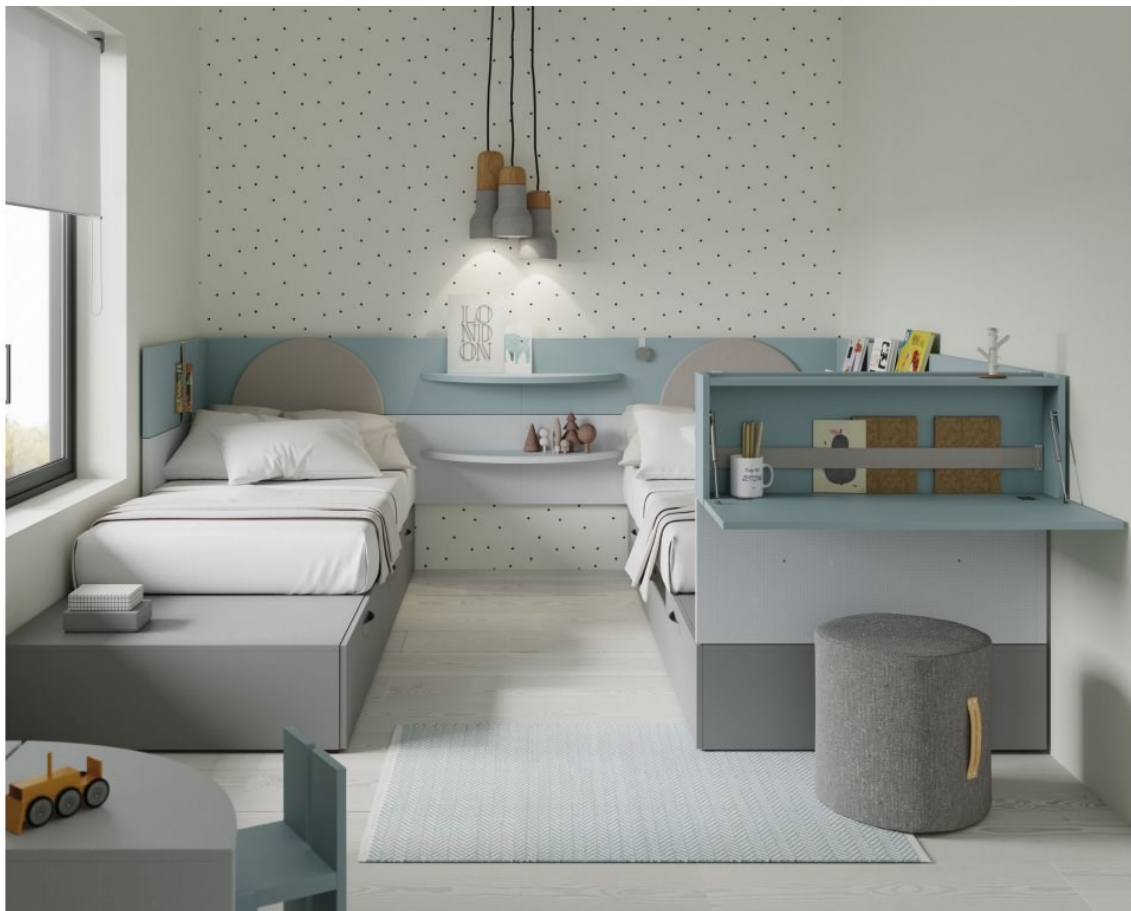
Postel je vlevo, vpravo je taky postel. Vepředu je malý stůl, malá židle. Dole je koberec. Nahoře je světlo.