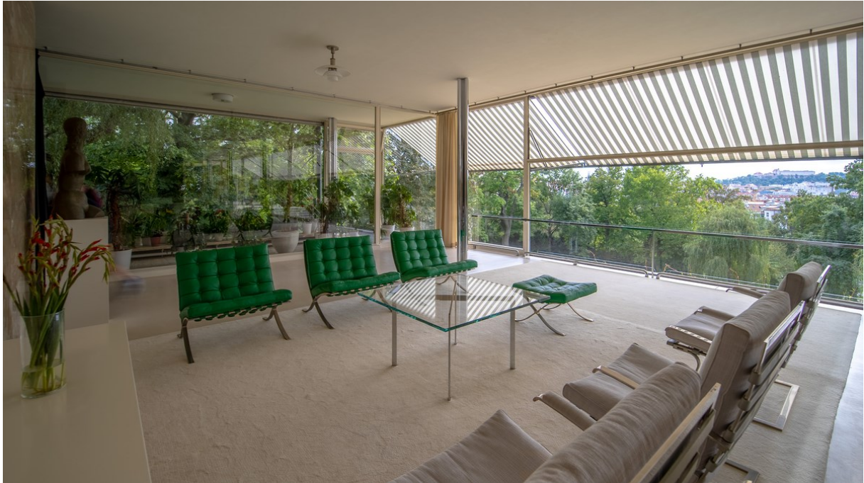
Vlevo máme zelená křesla, uprostřed je stůl; vzadu je zahrada