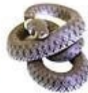
užovka grass snake