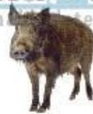
prase divoké wild boar