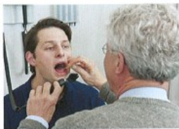
1. Má angínu.