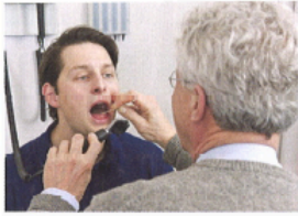
1. Má angínu.