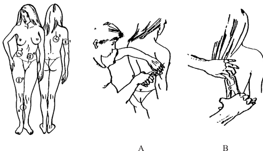
Obr. 1 Přehled měřicích míst

Z hodnot kožních řas (v mm) na paži (m.triceps brachii) a na zádech (nad lopatkou) určete i procento zastoupení tuku v organismu (orientační hodnota) – viz nomogram (obr. 2).