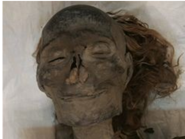
Mumie královny Hašesput