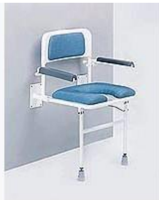
Sedačka do sprchy sklopná