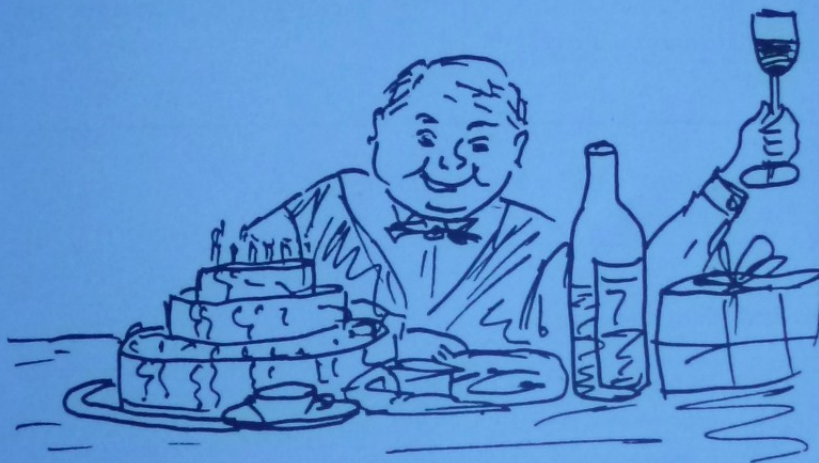
Slavil jsem narozeniny...