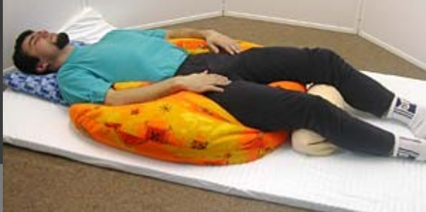
Poloha na zádech