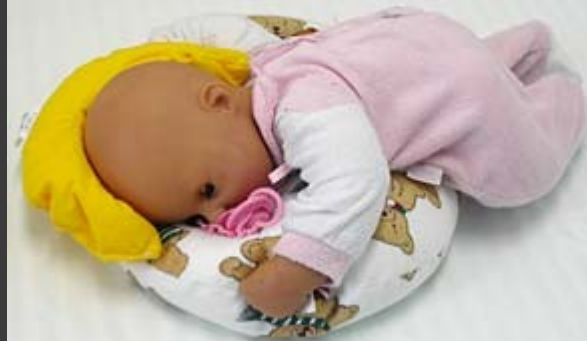
Novorozenec na boku