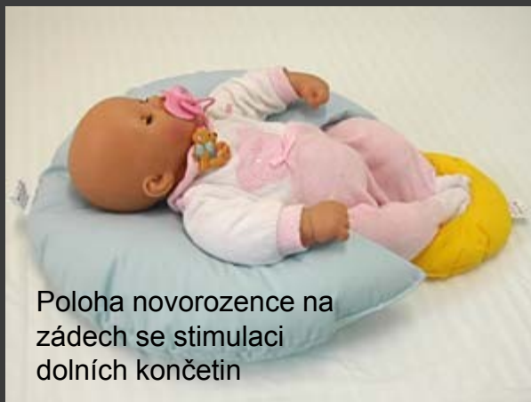
Poloha novorozence na zádech se stimulací dolních končetin