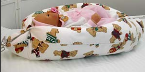
Pelíšek pro novorozence od 700g