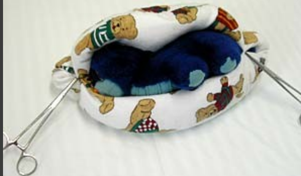
Pelíšek do inkubátoru