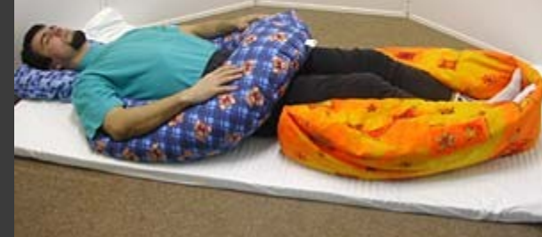
Poloha na zádech s profilaxí dolních končetin