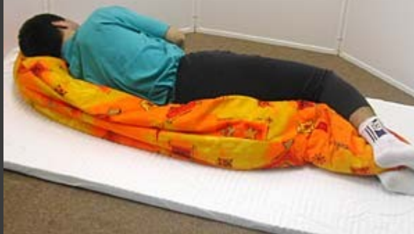
Poloha na boku, fixační, stimulační