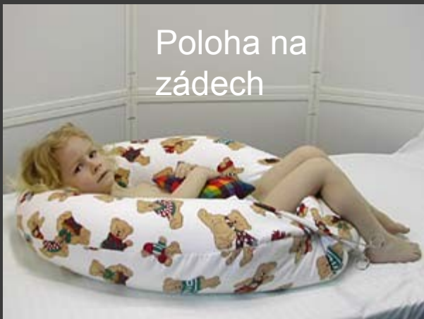
Poloha na zádech