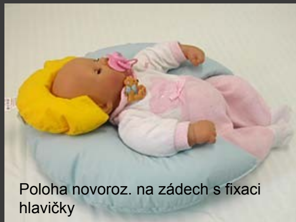
Poloha novoroz. na zádech s fixací hlavičky