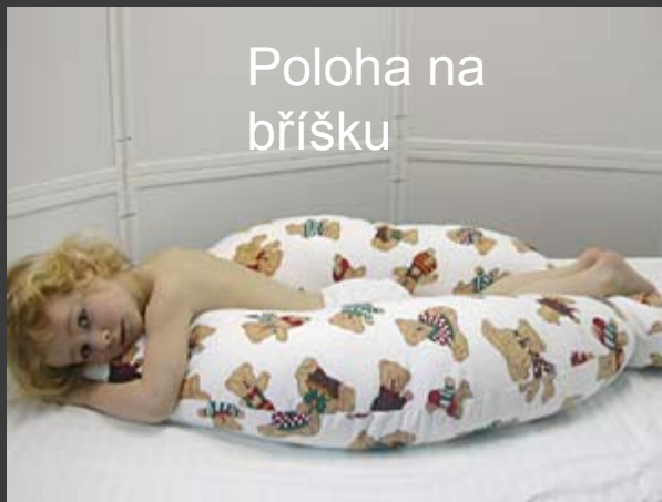
Poloha na bříšku