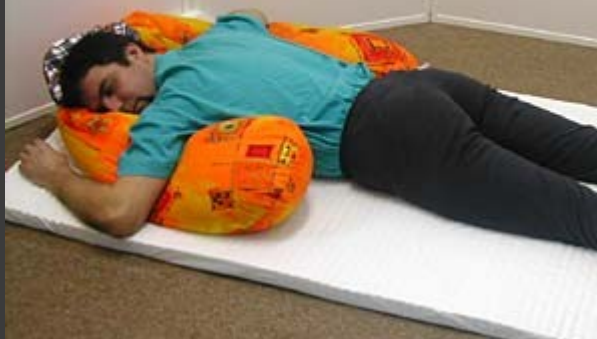
Poloha na hrudi, pronační