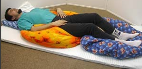
Poloha na zádech