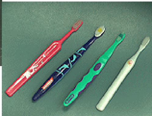
KARTÁČKY PRO NEJMENŠÍ