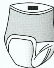
Obr. 36 Elastické plenkové kalhotky