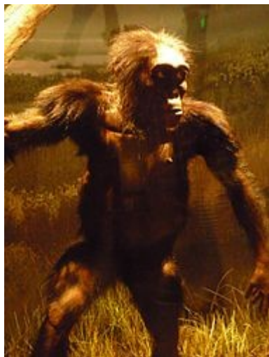
1. Australopithecus (žena)

Korekce z hlediska biologie: Člověk je opice.