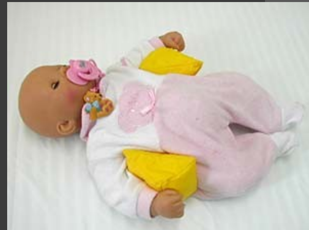
Klín do pažní jamky novorozence