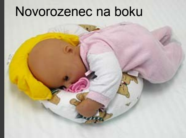
Novorozenec na boku