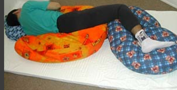
Poloha na boku, fixační, zklidňující