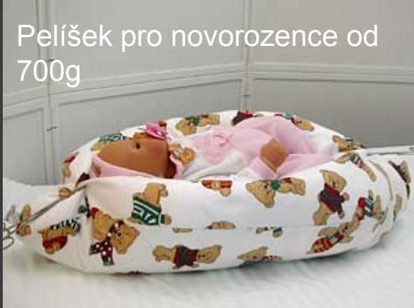
Pelíšek pro novorozence od 700g