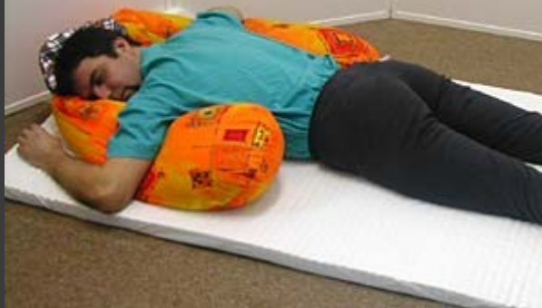
Poloha na hrudi, pronační