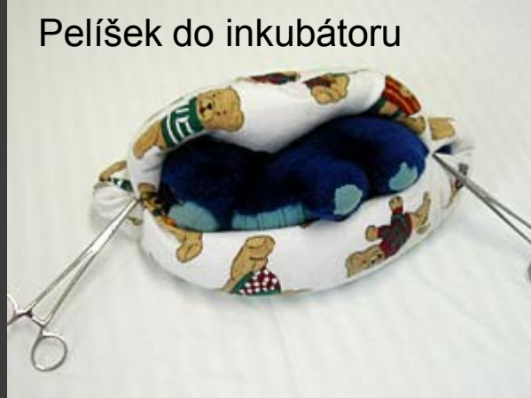
Pelíšek do inkubátoru