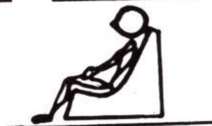
Obr.č.23 : Polohování

Fowlerova poloha při městnavé srdeční slabosti