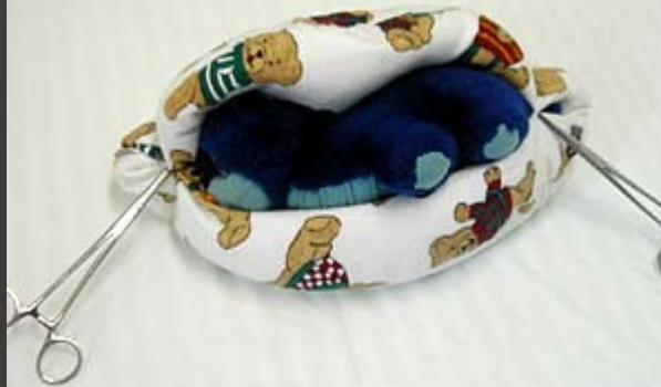
Pelíšek do inkubátoru