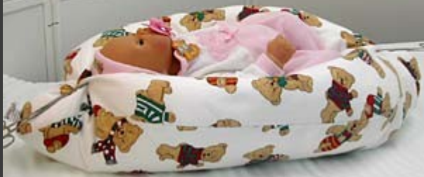
Pelíšek pro novorozence od 700g