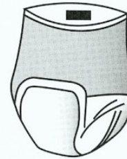
Obr. 36 Elastické plenkové kalhotky