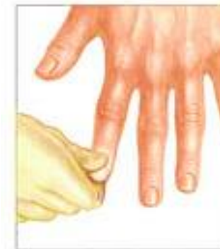
Pressure is applied to nail bed until it turns white