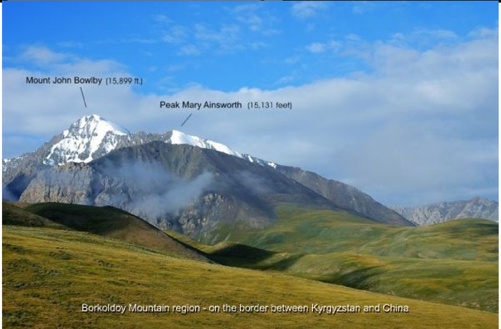
Borkoldoy Mountain region - on the border between Kyrgyzstan and China