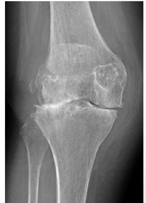
(obr. Těžká artróza kolene)