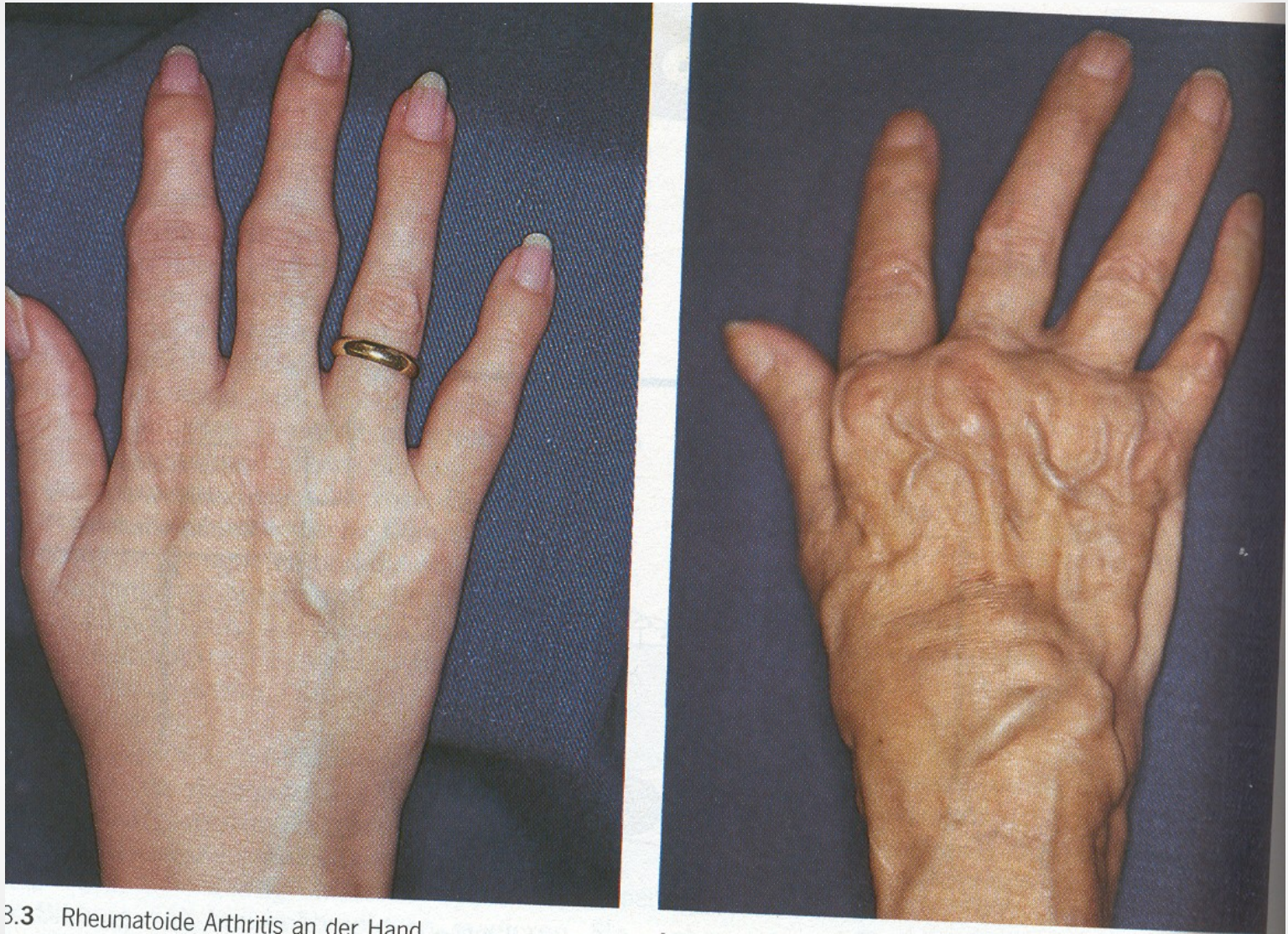
3.3 Rheumatoide Arthritis an der Hand