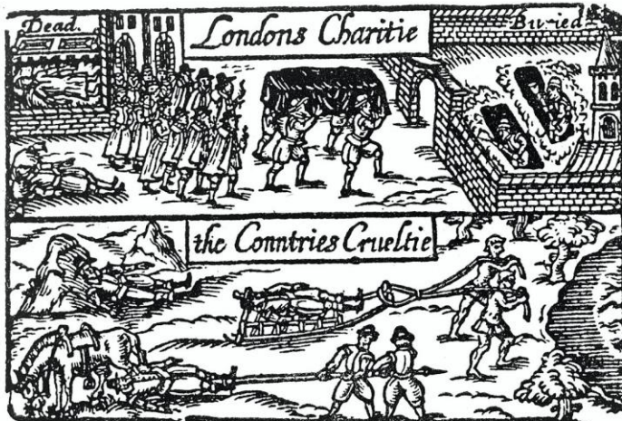
FROM TITLE PAGE OF "LONDONS LAMENTATION," 1641.