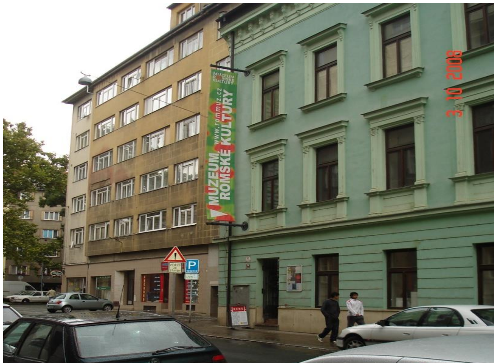
Muzeum romské kultury, Beharková, 2008