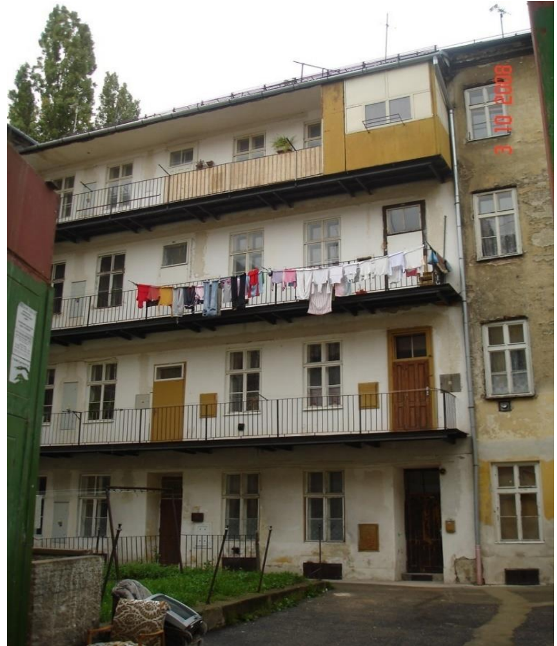
Bratislavská ulice Brno, Beharková, 2008