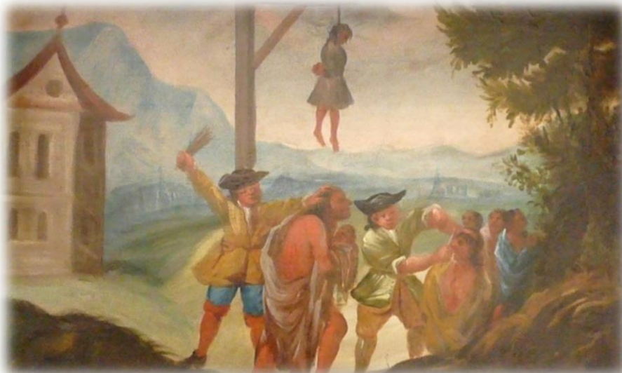
varovné cedule Muzeum v Nových Hradech