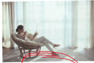
doma at home