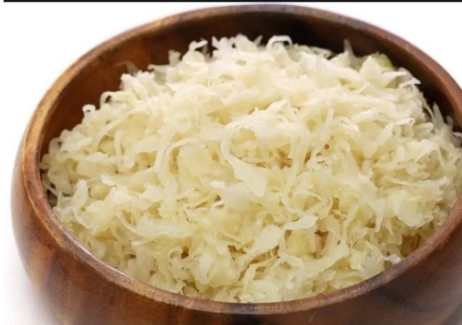
- olomoucké tvarůžky