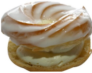
- kysané zelí (tuřanské)