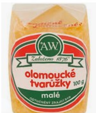
- točený salám