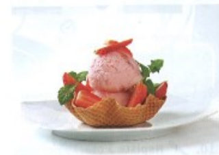
zmrzlina ice cream