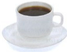
káva, coll. kafe coffee