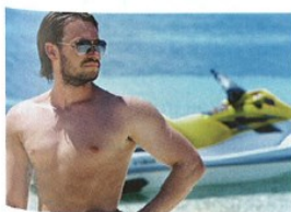
Jaký je ten muž?