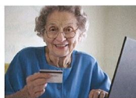
Jaká je ta žena?