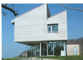
Jaký je ten dům?