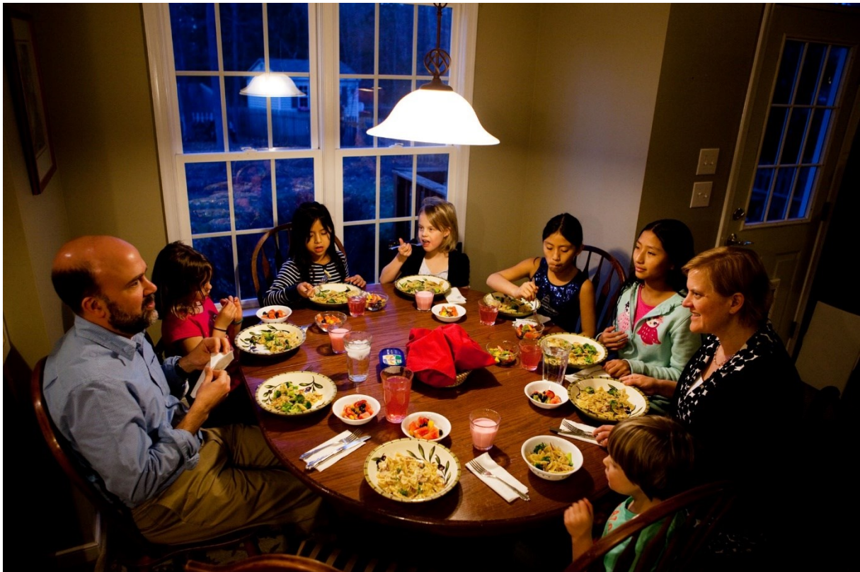
To je rodina. Jsou na večeři. = Oni večeří. Co večeří? Večeří jídlo.-