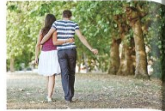
chodit s + I to go out with