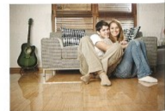
žít* s + I to live with