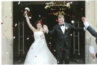
brát* si/vzít* si + A to get married to