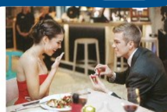
zasnubovat se/zasnoubit se s + I to get engaged to