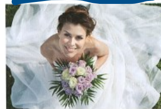
vdávat (se)/vdát (se) za + A o get married to (for a woman)