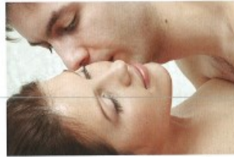
milovat se/pomilovat se s + I to make love to, to have sex with