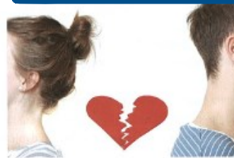
rozcházet se/rozejít* se s + I to break up with