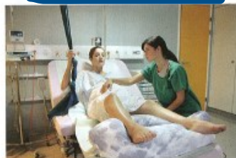
rodit/porodit dítě to give birth to a child