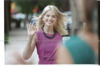
potkávat/potkat + A to meet, run into