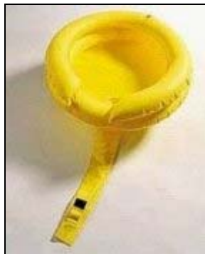
bazének na mytí hlavy