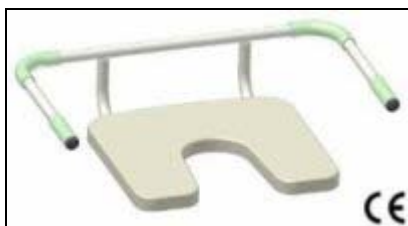
sedačka do vany