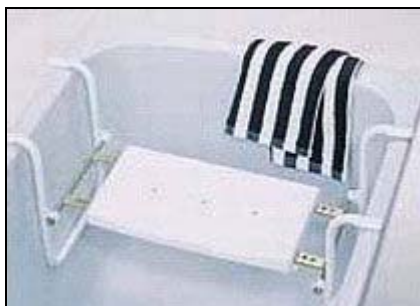
závěsná sedačka do vany