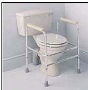
přenosná podpěra na WC