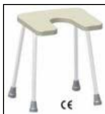
stolička do sprchy