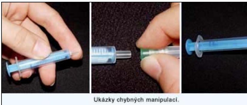
Ukázky chybných manipulací.