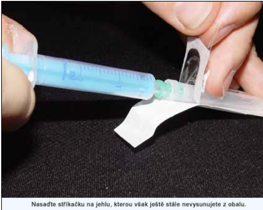
Nasadte stříkačku na jehlu, kterou však ještě stále nevysunujete z obalu.