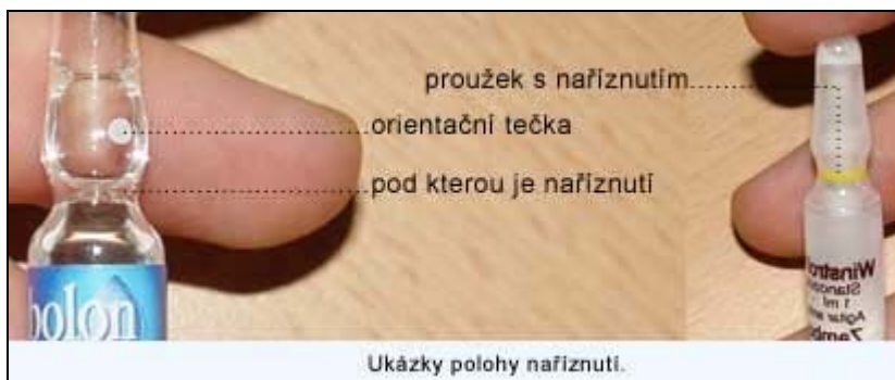
Ukázky polohy nařiznutí.