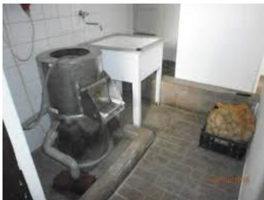
ŠKRABKA NA BRAMBORY