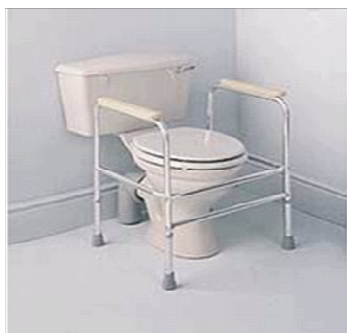
Přenosná podpora na WC