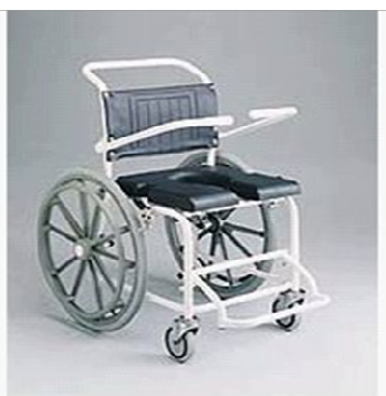
Pojízdná sprchová židle