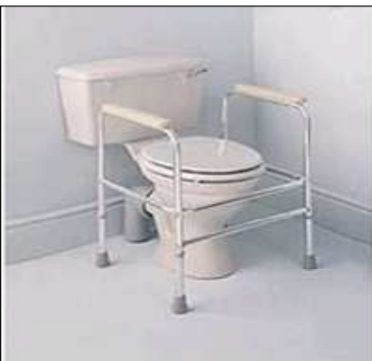
Přenosná podpora na WC