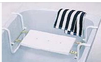
Závěsná sedačka do vany