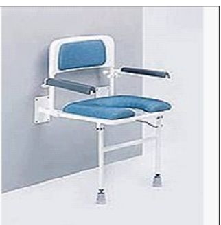
Sedačka do sprchy sklopná