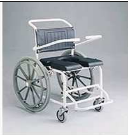
Pojízdná sprchová židle