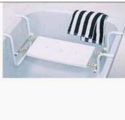
Závěsná sedačka do vany