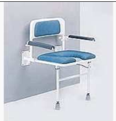
Sedačka do sprchy sklopná