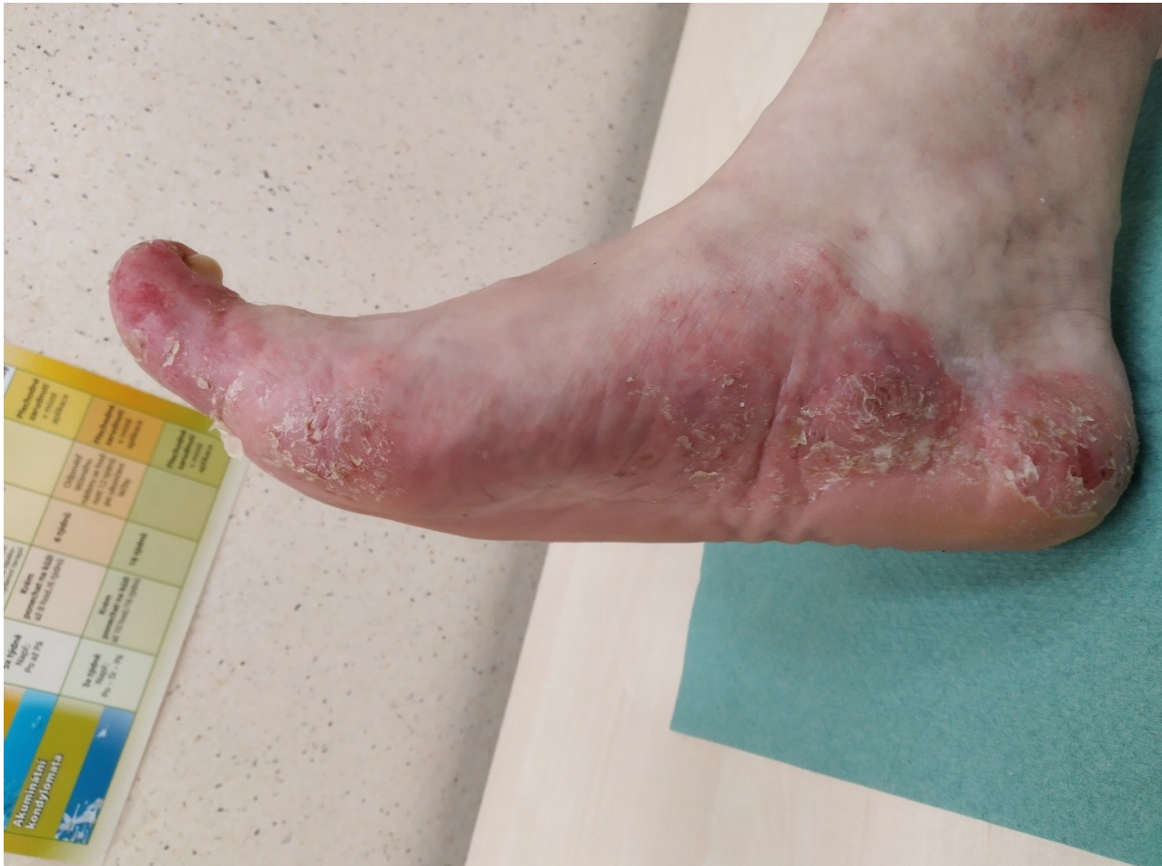
Ress.: Paradoxní reakce při th Adalimumab Pustulosis plantaris, psoriasiformní terče po těle