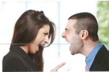
hádat se/pohádat se s + I to have an argument with