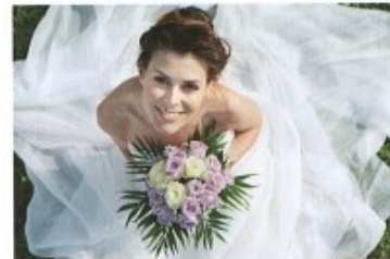
vdávat (se)/vdát (se) za + A to get married to (for a woman)