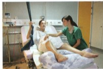
rodit/porodit dítě to give birth to a child