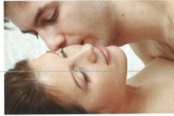
milovat se/pomilovat se s + I to make love to, to have sex with