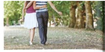
chodit s + I to go out with