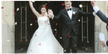
brát* si/vzít* si + A to get married to

2 Complete the story with suitable verbs. Do NOT change their forms. There is one extra verb that you do NOT need.