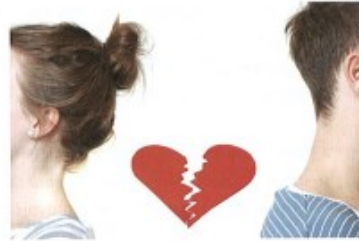
rozcházet se/rozejít* se s + I to break up with