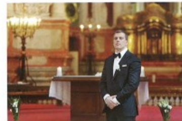
ženit se/oženit se s + I to get married to (for a man)