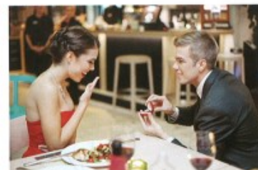
zasnubovat se/zasnoubit se s + I to get engaged to