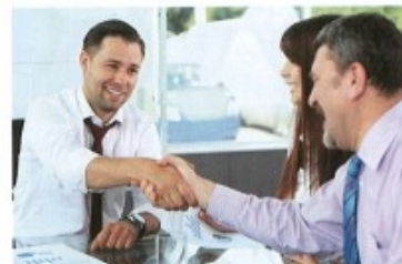
seznamovat se/seznámit se s + I to meet