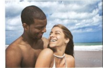
zamilovávat se/zamilovat se do + G to fall in love with