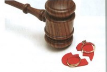
rozvádět se/rozvést* se s + I to get divorced from