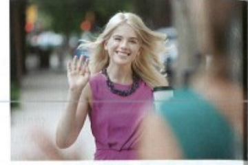
potkávat/potkat + A to meet, run into