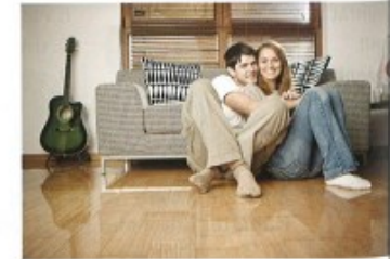
žít* s + I to live with