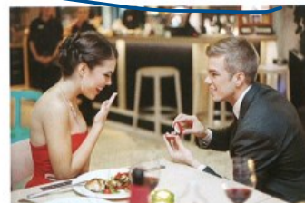
zasnubovat se/zasnoubit se s + I to get engaged to