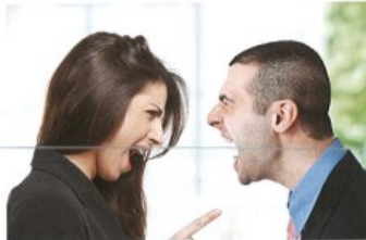
hádat se/pohádat se s + I to have an argument with