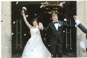
brát* si/vzít* si + A to get married to