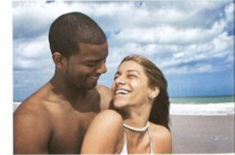
zamilovávat se/zamilovat se do + G to fall in love with