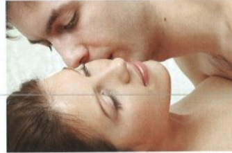
milovat se/pomilovat se s + I to make love to, to have sex with