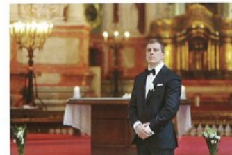
ženit se/oženit se s + I to get married to (for a man)