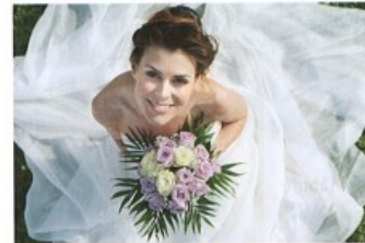
vdávat (se)/vdát (se) za + A o get married to (for a woman)