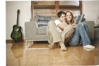
žít* s + I to live with

HÁDALI, CHODILI, MĚLI, ROZEŠLI, ROZVEDLI, SEZNÁMILI, VZALI, ZAMILOVALI, ŽILI