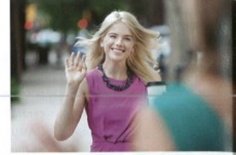
potkávat/potkat + A to meet, run into