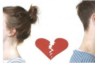
rozcházet se/rozejít* se s + I to break up with