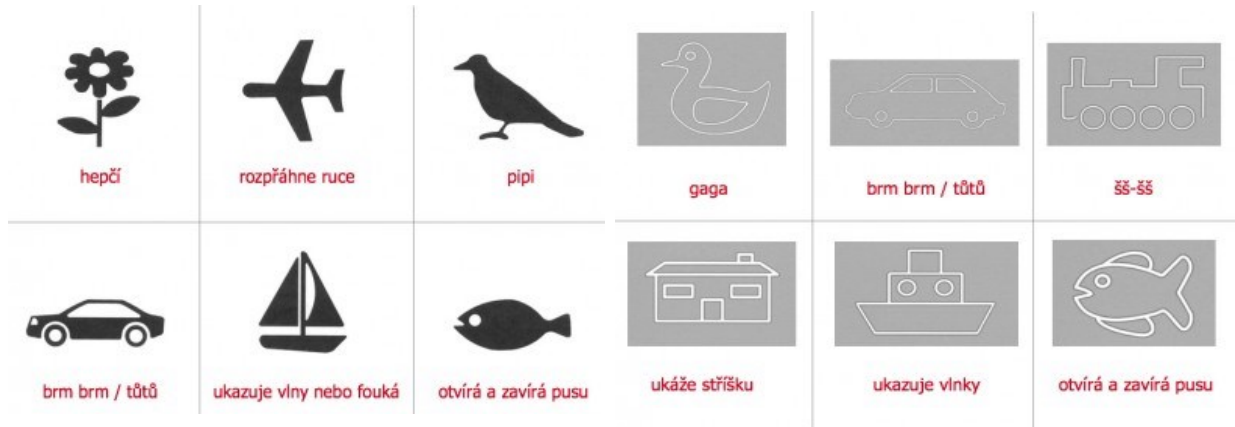
Obr. 9: Popis obrázků citoslovcí

I jednoduchým citoslovcem můžete naučit dítě popsat obrázky. Nejlepší si zjistit, jaké obrázky jsou v ordinaci používány, abyste mohli seznámit dopředu své dítě. Trénováním popisu obrázku může vyšetření proběhnout rychleji.