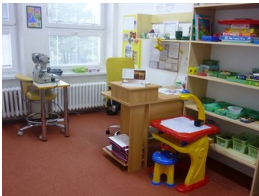
Obr. 5: Ukázka dětské ambulance