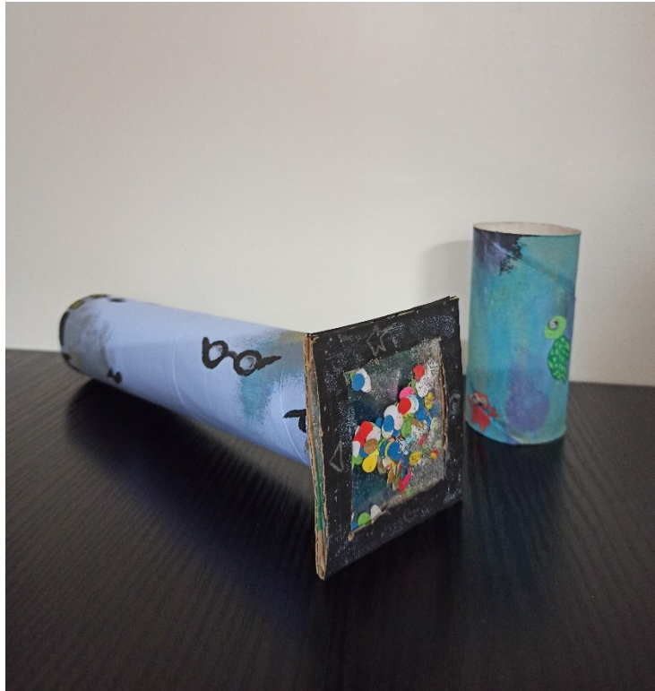
Obr. 7: Domácí výroba kukátka a kaleidoskopu

Jedná se o metodu, kdy musíte dítě připravit k nácvičku fixace pro měření refrakce stolním nebo ručním refraktometrem. Trénink pro děti je možné pohledem do starého fotoaparátu, kaleidoskopu, kukátka nebo ruličky od toaletního papíru. Dítě bude připraveno se dívat do přístroje a nebude to pro něj něco nového. Dítě je také zvědavé z toho, co uvidí.