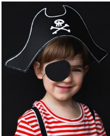
Obr. 6: Páska přes oko při hře na piráty

Aby si dítě lépe zvykalo na zakrytí oka, můžete využít hru a zahrát si doma na piráty. Dítě pak při vyšetření nebude ve stresu z nalepení okluzoru. Můžete pouštět dítěti pohádky o pirátech. Popřípadě si hrát tak, že si navzájem budete zalepovat oko vyrobeným okluzorem z náplasti, nejprve na sobě, hračkách, sourozencích a až pak dítěti.