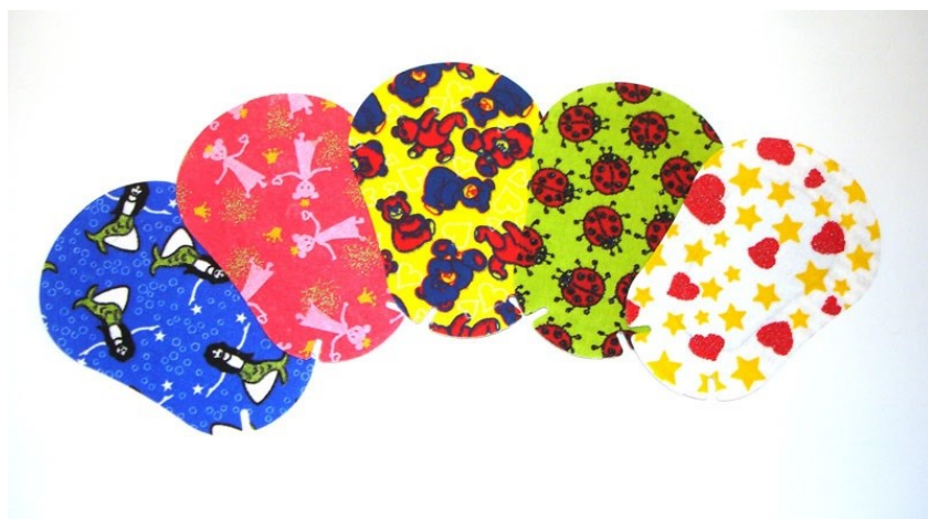
Obr. 4: Dětské okluzory