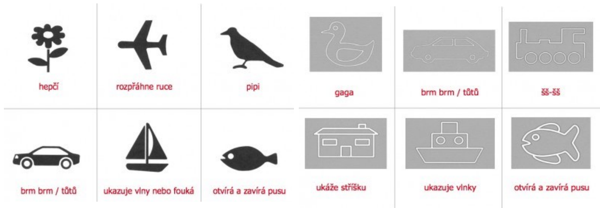
Obr. 9: Popis obrázků citoslovcí

I jednoduchým citoslovcem můžete naučit dítě popsat obrázky. Nejlepší si zjistit, jaké obrázky jsou v ordinaci používány, abyste mohli seznámit dopředu své dítě. Trénováním popisu obrázku může vyšetření proběhnout rychleji.