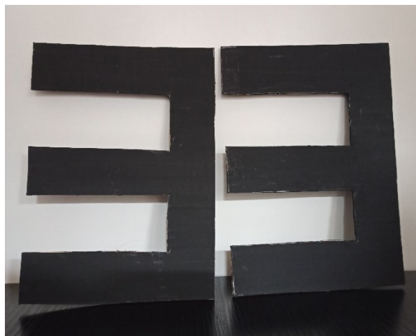
Obr. 10: Domácí výroba velkého E

Dítě ukáže rukou, ve kterém směru je E otočené (kam ukazuje „hřebínek“ nebo „nožičky“), tj. rukou nahoru, dolů, doprava a doleva. Podobné "úkoly" bude totiž zadávat oftalmolog.