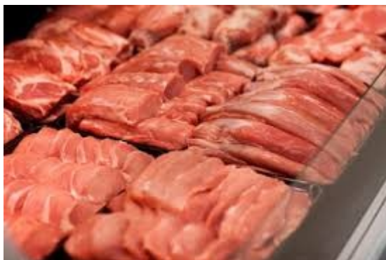
HRUBÁ PŘÍPRAVNA MASA