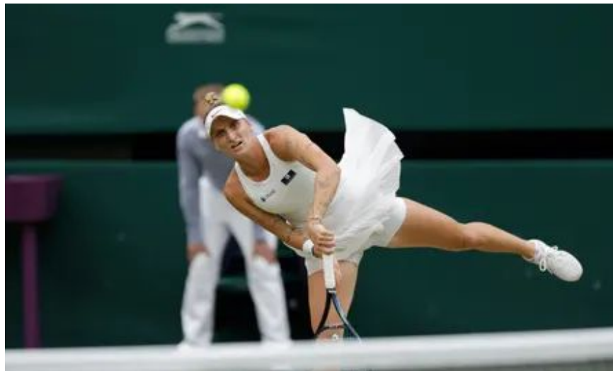
Markéta Vondroušová vyhrála na Wimbledonu ve dvouhře žen.