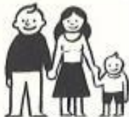
on, ona, to