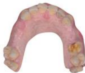
Částečné snímatelné náhrady