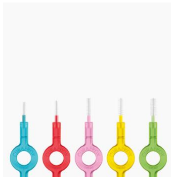
Obr. 3: Mezizubní kartáčky TePe Obr.4: Mezizubní kartáčky CURAPROX