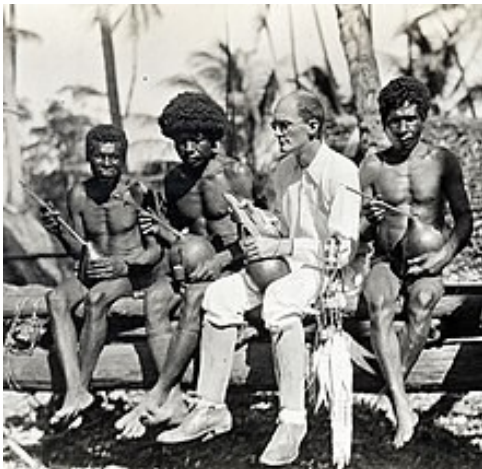
Bronisław Malinowski (1884–1942)

Antropologové, sociologové, psychologové a historici zkoumají morální normy, které se odrážejí v profesní praxi, etických kodexech, institucionálních prohlášeních, pravidlech a veřejných politikách.