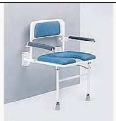
Sedačka do sprchy sklopná