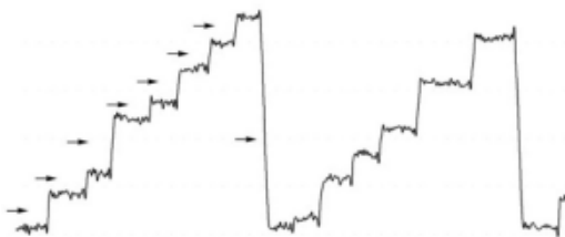
Obr. 2. EOG záznam při čtení, šipky označují sakadické pohyby

Popis záznamu: Pohyb očí doprava odpovídá výchylce směřující nahoru, pohyb doleva výchylce směřující dolů. Sklon křivky udává rychlost pohybu. Sakadické pohyby se zobrazují jako strmé výchylky, jejichž amplituda je přímo úměrná velikosti sakády (obr. 2).