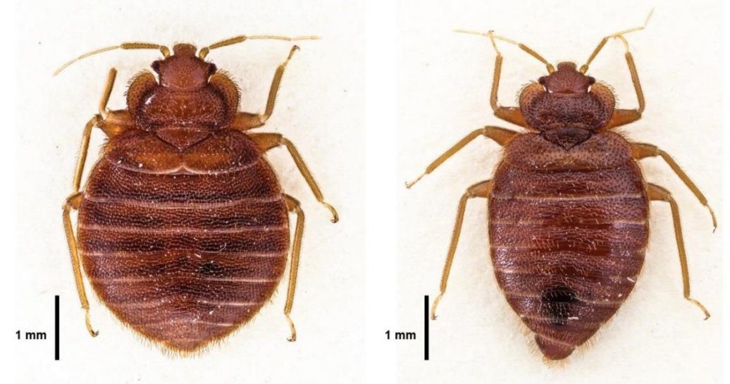
Obrázek č. 1: Štěnice domácí C. lectularius , vlevo = samice; vpravo = samec