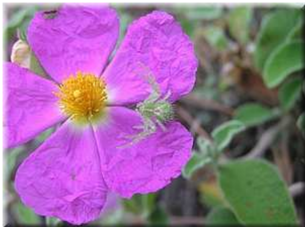
Běžník číhající na kořist

Živočišná skladba je také velmi pestrá. Na počátku léta, kdy rostliny makchie vykvétají, můžeme pozorovat velké množství hmyzu, který je právě na květy vázán a vytváří téměř "společenstvo květů". Takto jsme pozorovali stehnáče, řadu tesaříků nebo zlatohlávky Cetonia , Oxythyrea . V květech byli přítomni též predátoři, ať běžníci, kteří se maskují v květech, nebo roupci, kteří unášeli svou kořist z květů.