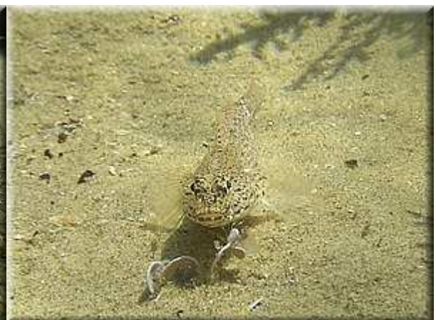
Hlaváč Gobius genoporus