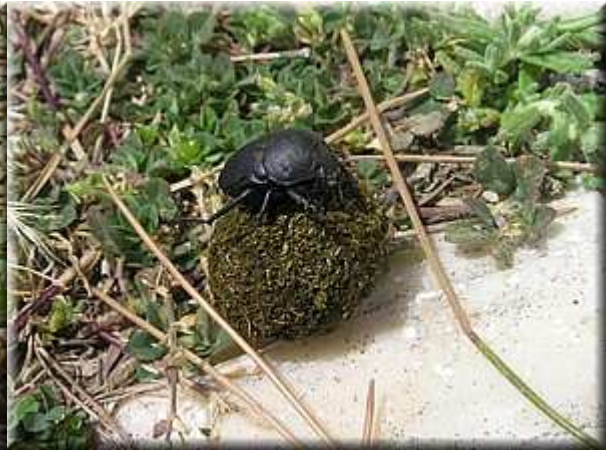
Téměř dokončená kulička Gymnopleurus

Pod kameny na pastvinách lze často nalézt velkou stonohu rodu Scolopendra . Je mírně jedovatá a alergikům může způsobit vážné problémy. Stejně tak pod kameny, ale i v blízkosti lidských obydlí se nepříliš vzácně vyskytují snovačky (černé vdovy), které jsou již jedovaté podstatně více a kousnutí může vzácně (asi v 8 % případů) skončit i smrtí.