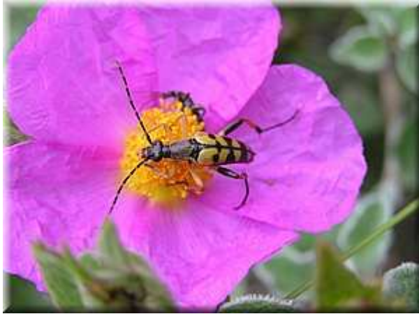
Tesařík ( Phytoecia coerulescens )