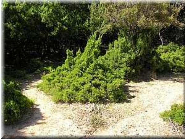
Vřesovec stromovitý ( Erica arborea )