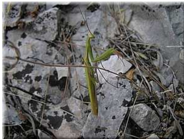
Kudlanka nábožná Mantis religiosa - dospělec (konec léta)

Nepřehlédnutelné je druhové bohatství sarančat a kobylek. V porostu se vyskytuje i dravá kudlanka nábožná ( Mantis religiosa ). Směrem na jih se zvětšuje i druhová rozmanitost kudlanek.