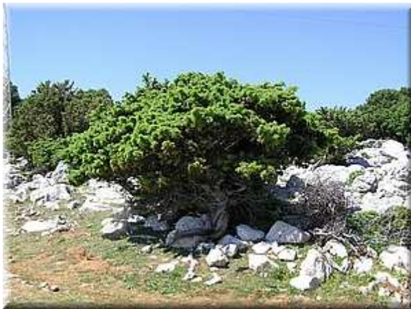
Jalovec červenoplodý ( Juniperus oxycedrus )

Borovice pinie Pinus pinea . Pochází ze Středomoří. Bílá piniová zrna jsou uložena v tvrdých, hranatých bezkřídých piniových oříšcích, které se nacházejí v osemení, které potřebuje k vyžrání tři roky. Teprve ve čtvrtém roce se oříšky uvolní. Oříšky se konzumují syrové. Kvůli svému vysokému obsahu tuku (60 %) semena rychle žluknou.