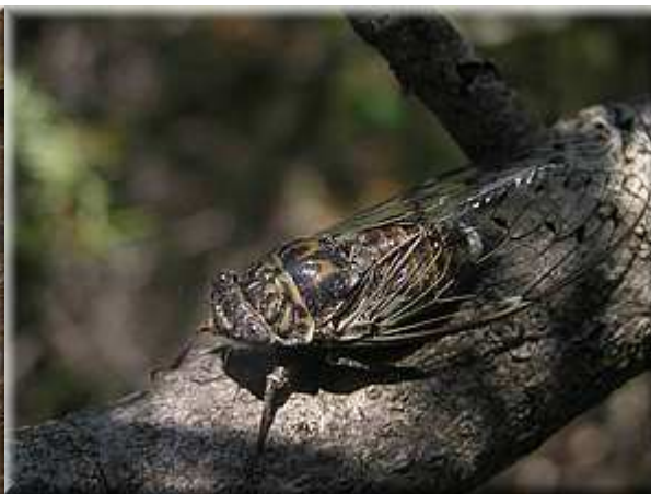
Nymfa cikády - začátek léta