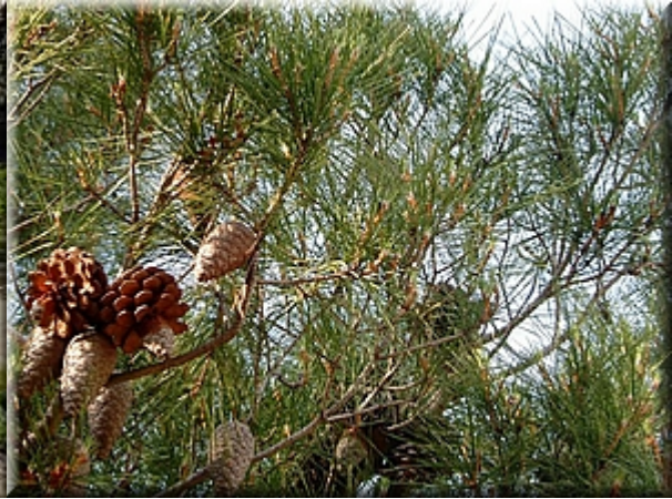
Borovice přímořská ( Pinus pinaster )