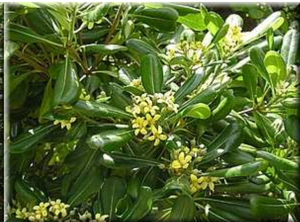
Lokvát japonský (Mišpule) Eriobotrya japonica