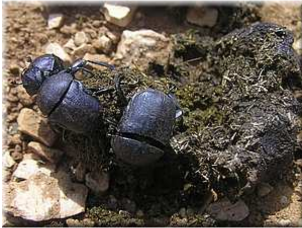
Boj o kuličku Gymnopleurus sp.

Trus pasoucích se zvířat skýtá bohatý zdroj potravy pro řadu koprofágních brouků, ať již drobní lejnožrouti rodu Onthophagus , chrobáci a vrubouni. Za pozorování stojí chování těchto brouků při rozmnožování. Někteří vyhrabávají komůrky v zemi v blízkosti objevených výkalů. Řada druhů vytváří z trusu kuličky, které společně jeden pár transportuje i na poměrně velké vzdálenosti od zdroje. Někdy se stává kulička příčinou urputných bitev mezi dvěma páry.