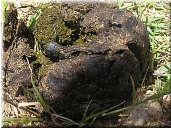
Počátek stavby kuličky Sisyphus sp.