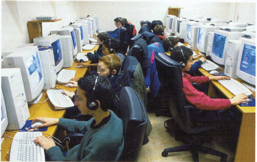
Jeux PC en réseau

CharlÉlie Couture Le Monde interactif, Le Monde, 19 mai 2000, supplément Le Monde interactif