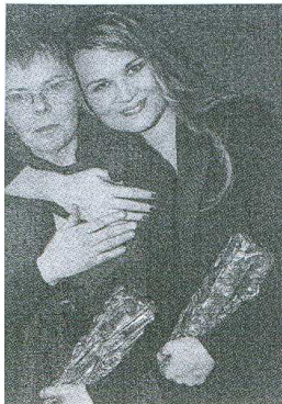
➤ La réalisatrice Pascale Ferran, César du meilleur film pour Lady Chatterley , incarnée par Marina Hands, César de la meilleure actrice.

Déjà vendu presque partout dans le monde et élu meilleur film français de l'année par le prix Lumière, décerné par la presse étrangère, Ne le dis à personne a également reçu les honneurs de la profession.