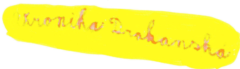
Rodina podle Veroniky